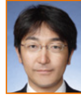
眞上 晋 大分城西 RC (第 1 回)