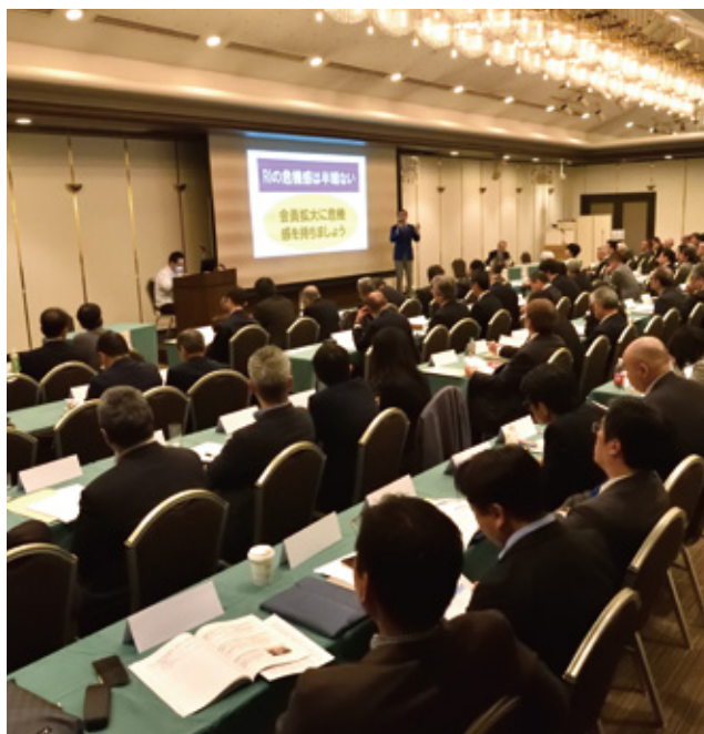
▲ 3月2~3日 PETSの様子