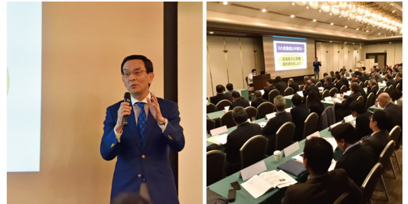
▲ 3月2～3日 PETSの様子