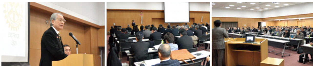
▲ 2月2日 ローター財団 補助金セミナーの様子