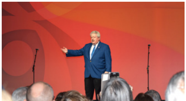
▲ 1 月 12～18 日 国際協議会の様子