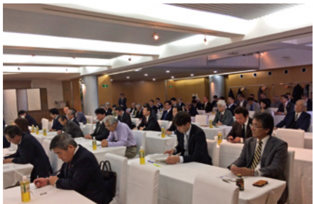
▲ 12月2日 職業奉仕大会の様子