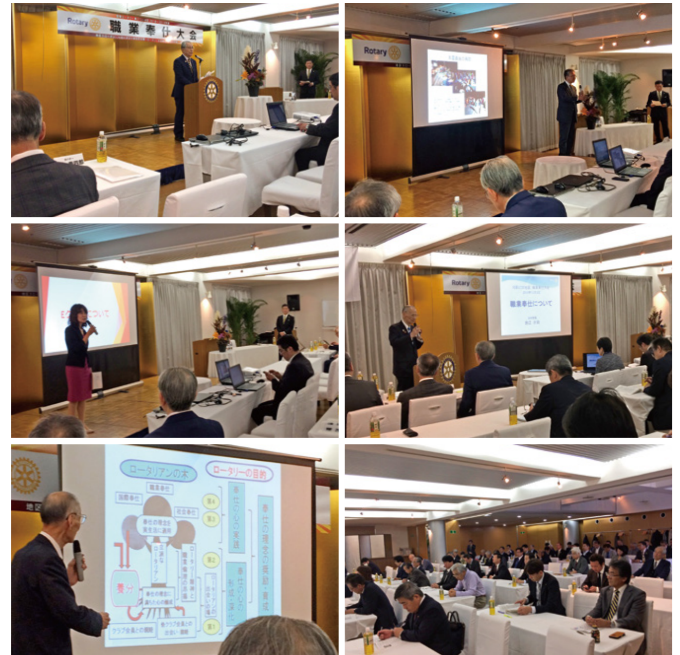
▲ 12月2日 職業奉仕大会の様子