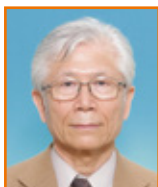
鴻江 和洋 荒尾 RC (第 1 回)