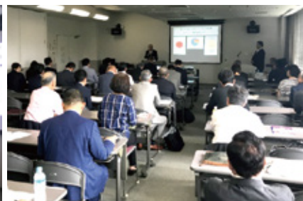
▲ 10月6日 ロータリー財団研修セミナーの様子