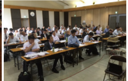
▲ 9月15日 ローターリー財団研修セミナー