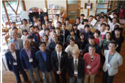
▲ 9月8~9日 RYLA セミナー