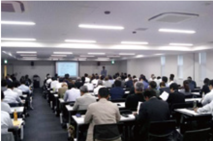
▲ 9月1日 青少年・公共イメージセミナー