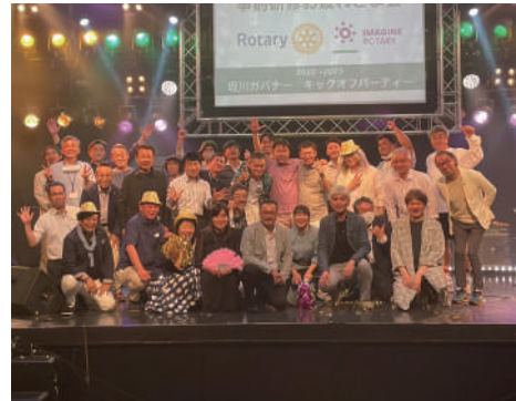
堀川年度キックオフ

続く熊本南 RC の親睦カラオケ会もチャリティ化。「楽しむだけではなく、支援につながる場にしたい」という思いが形となっています。