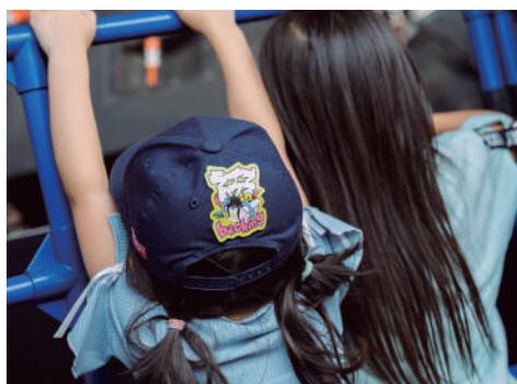
チャリティステッカーを着けたこども