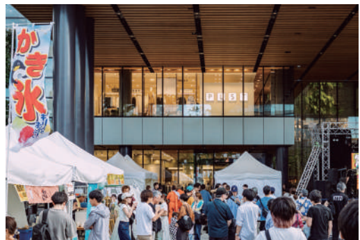
駅前で開催した野外イベントの賑わい

さらに自治会長として周辺地域とも積極的に連携。ライブハウスで自治会を開催するなど、新しいコミュニティづくりにも力を入れています。