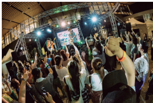
野外イベントの賑わい Part2